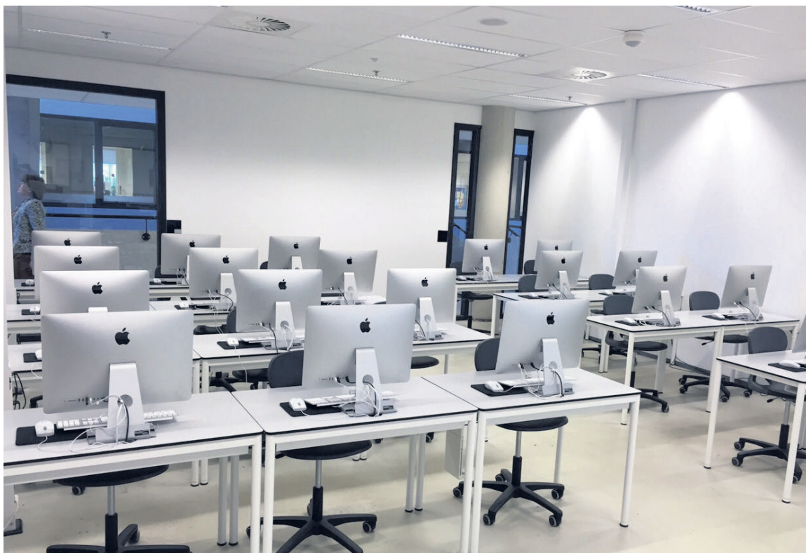
MacHelp schept de randvoorwaarden voor een optimale ict omgeving

komt, is er iets te vinden. Tevens kan de klant in het servicepunt ook technische vragen stellen.